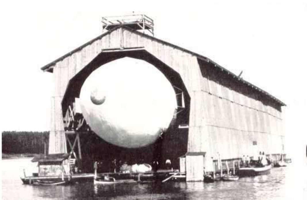
Úszó hangár a Bódeni tavon